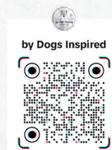
TikTok By Dogs Inspired