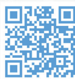
Facebook By Dogs Inspired