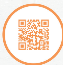
BDI Methode By Dogs Inspired